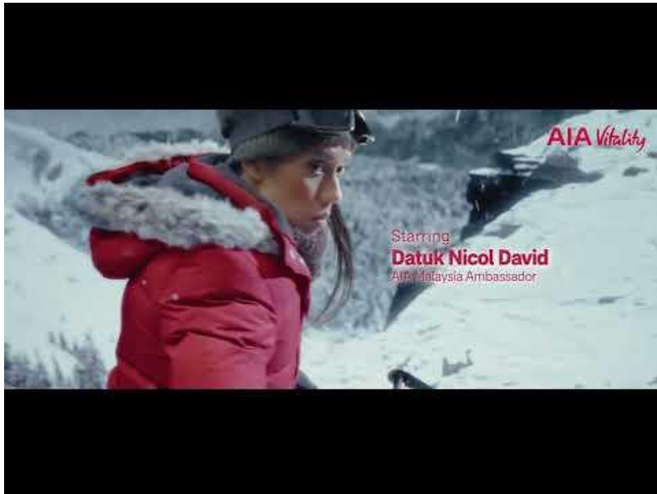
Duta AIA Malaysia, Datuk Nicol David membintangi Kempen "Pilih Kehidupan yang Lebih Bermakna" Klik untuk menonton filem jenama.

Kempen ini merupakan ekspresi kreatif berdasarkan hasrat AIA untuk memperkasakan rakyat Malaysia menjalani kehidupan yang lebih bermakna yakni kehidupan yang sihat, aktif dan bertenaga. Memanfaatkan minat rakyat Malaysia terhadap platform penstriman atas permintaan, AIA mendapat inspirasi untuk menghasilkan sebuah penceritaan jenama yang sesuai dan relevan untuk khalayak umum dengan mengetengahkan produk serta tawaran-tawaran syarikat tersebut sebagai filem dan rancangan TV yang disesuaikan mengikut profil masing-masing.